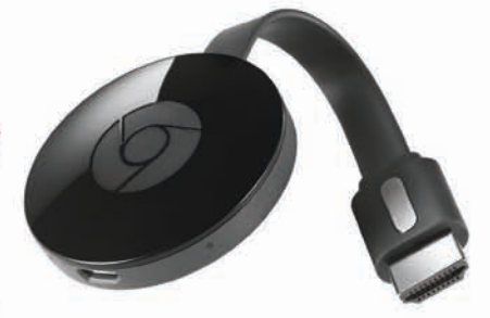
Google Chromecast is a trademark of Google LLC

今なら3ヶ月プランへのお申込みで グーグル クロームキャストを もれなくプレゼント!