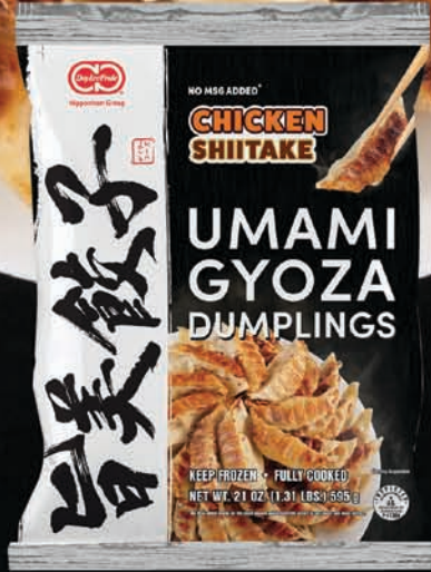
CHICKEN & SHIITAKE