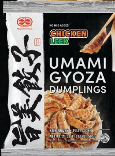
CHICKEN & LEEK