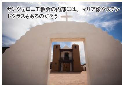
サンジェロニモ教会の内部には、マリア像やステンドグラスもあるのだそう