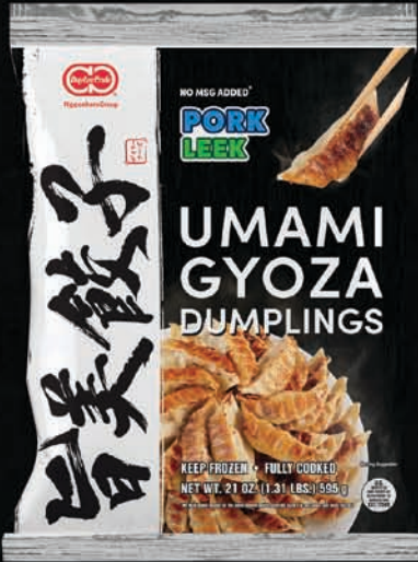
PORK & LEEK