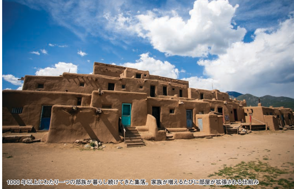
1000年以上にわたり一つの部族が暮らし続けてきた集落。家族が増えるたびに部屋が拡張される仕組み

タオス・プエブロの見どころの一つとなっているのが、サンジェロニモ教会。現在の建物は、オリジナルの教会がアメリカ軍とメキシコ軍の間の領土をめぐる戦いで1847