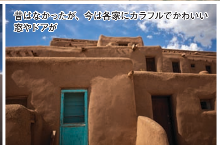
昔はなかったが、今は各家にカラフルでかわいい窓やドアが

年に破壊されたため、1850年に再建されたもの。日干しレンガの壁の一部分が真っ白に塗られた教会は、ひときわ目を引く。また、それよりも前に建てられたオリジナルの教会も、今は廃墟としてその姿を残している。こちらは1619年に最初に建てられたものが1680年に起きた反乱で崩壊し、その後すぐに同じ場所に再建された教会跡。16世紀にメキシコの地へ進出したスペイン人はアメリカにも勢力を伸ばし、先住民をカトリックへと改宗させていった。そのため現在も、この地に住むプエブロ人たちのほとんどがカトリックの信者なのだそう。